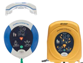
NEU! Optional mit WiFi Anbindung